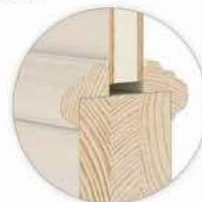
68 DF / zoom /