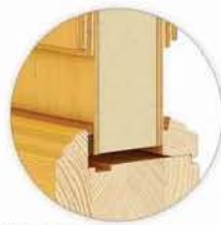
92 Retro / zoom /

Porte avec des pardosses décoratives en forme de pipe.